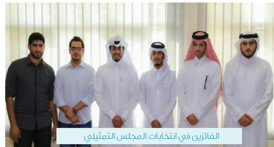
الفائزين في انتخابات المجلس التمثيلي