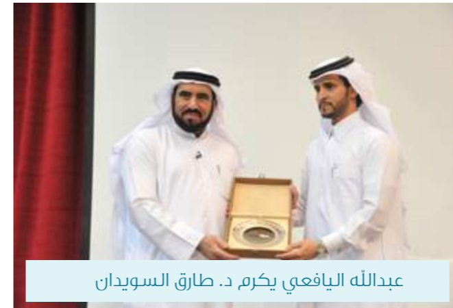
عبدالله اليافعي يكرم د. طارق السويدان

واستطرد في حديثه عن العلاقات مبيناً أنها مستويات ويجب ألا يتعدى مستوى على آخر، موضحاً أن العلاقة مع الله هي الأهم تليها العلاقة مع الوالدين، ثم الأرحام، ثم