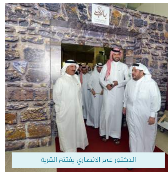
الدكتور عمر الأنصاري يفتتح القرية

وسط أجواء تراثية بهيجة افتتح الدكتور عمر الأنصاري نائب رئيس الجامعة لشؤون الطلاب يوم الأحد الموافق ١٥ /مارس/