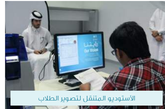
الأستوديو المتنقل لتصوير الطلاب

وقد أعرب كثير من الطلاب عن سرورهم بسهولة تعامل قسم البطاقات الجامعية معهم مما يعكس أهم أهداف القسم في تسهيل الخدمات الجامعية الموصولة للطلاب. هذا ويعتبر