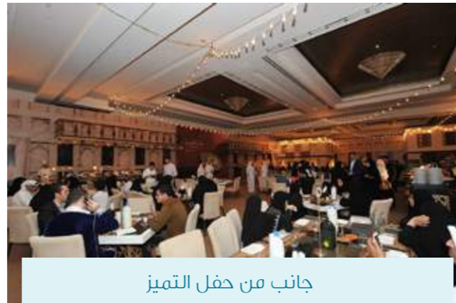
جانب من حفل التميز