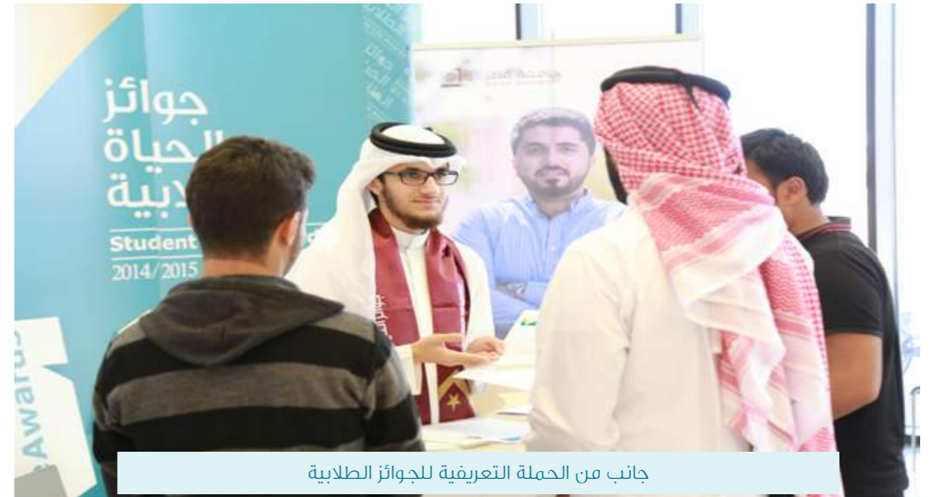
جانب من الحملة التعريفية للجوائز الطلابية