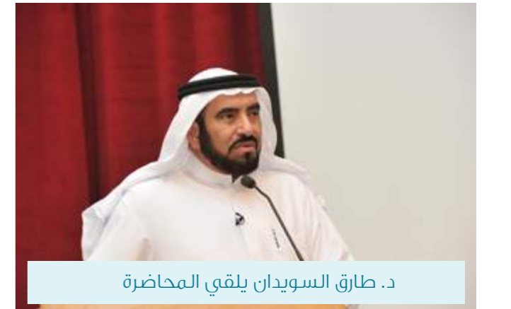
د. طارق السويدان يلقي المحاضرة

وتناول الدكتور طارق في محاضراته عدة محاور من ضمنها الفشل وضرورة التعلم من خلاله، إضافة إلى عوامل النجاح ومن أبرزها أن ينجح الإنسان مع نفسه وذاته، إذن أن كل إنسان مسؤول عما يحدث له، كما أن العلاقات من أهم عوامل النجاح بشرط أن لا تغطي على الجوانب الأخرى، مضيفاً: « ما قيمة أن ينجح الإنسان وهو فاشل في علاقته بالمحيطين به.»