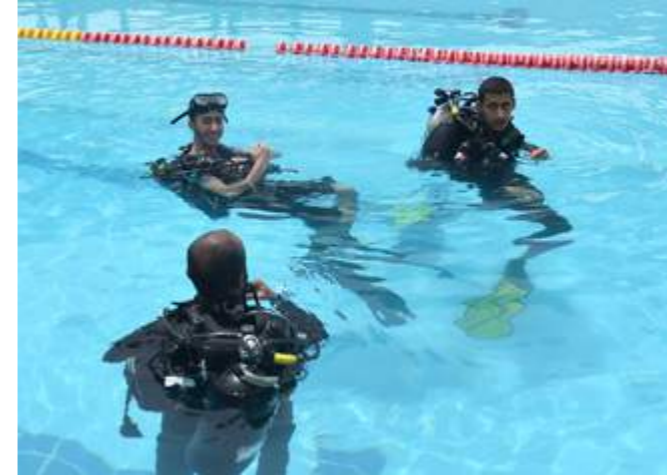
فريق أمن السواحل والحدود