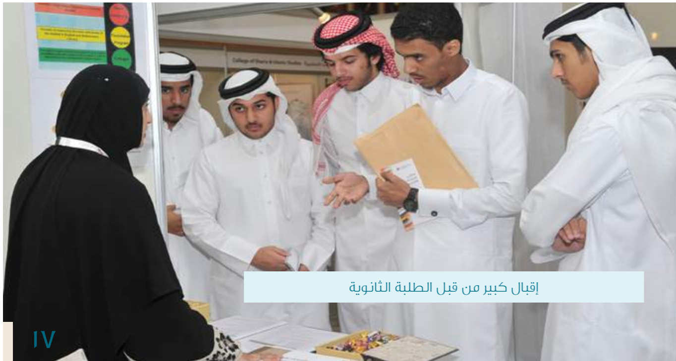
إقبال كبير من قبل الطلبة الثانوية