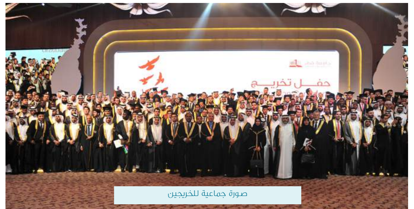
صورة جماعية للخريجين