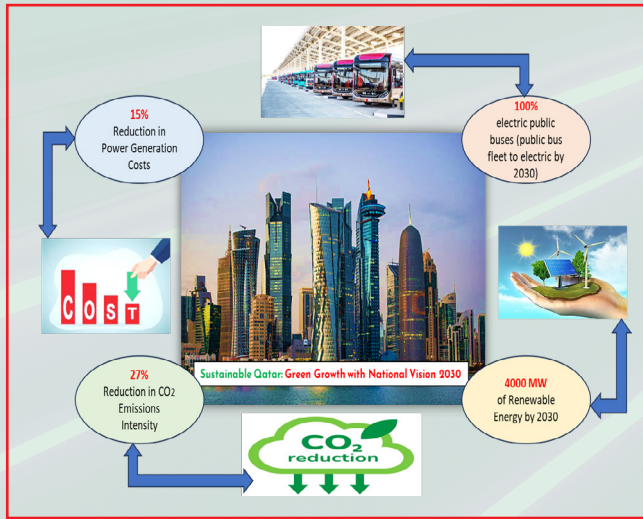
الشكل (3): نظام الطاقة المتطور بدولة قطر بحسب إطار الرؤية الوطنية 2030 .

يعكس هذا البحث قيادة جامعة قطر في مجال الابتكار المستدام. ومن خلال دمج التقنيات المتقدمة وتكامل الطاقة المتجددة والاستراتيجيات التي تتمحور حول المستهلك، تسعى الجامعة إلى وضع معايير للتنقل